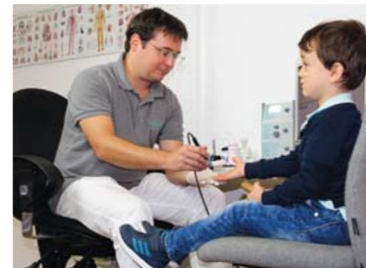
Testung und Therapie mittels der Bioresonanz sind völlig schmerzfrei.