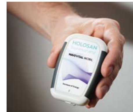
Wavevital – das kleinste Bioresonanz-Gerät der Welt passt in die Hosentasche.

stätigt wird. Demnach besteht alles im Universum aus einer unvorstellbar großen Anzahl elektromagnetischer Schwingungen – auch der menschliche Körper. Jedes Organ hat seine eigene gesunde Schwingung und reagiert nach dem Resonanzprinzip auf Schwingungen von außen. Ist ein Organ krank, ändert sich seine Schwingung. Außerdem können schädigende Schwingungen von außen das körpereigene Frequenzmuster durcheinander bringen.